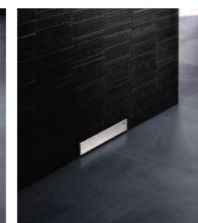
Évacuation murale intégrée au mur pour un sol entièrement dégagé.