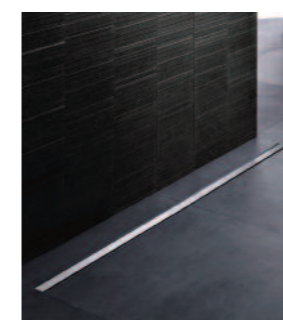
Canivelle CleanLine nouvelle élégance, avec filtre à cheveux et natte d'étanchéité intégrée. Longueur ajustable.

Pour assurer une étanchéité permanente, une natte est systématiquement injectée et préfixée en usine par Geberit, au niveau de l'évacuation. Le carreleur n'a plus qu'à la déplier lorsqu'il réalise la finition du sol de la douche, évitant une perte de temps. Ce film présente également l'avantage d'améliorer l'isolation acoustique du système en atténuant sensiblement le bruit d'écoulement de l'eau.