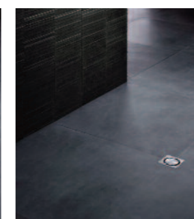
Grille centrale design intemporel, avec filtre à cheveux et natte d'étanchéité intégrée. Siphon compact optimisé.